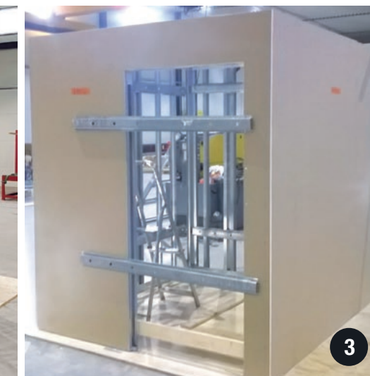
1. Yksilöidyt seinäelementtitoimitukset. 2. Kohteen mukaan valmistettu kylpyhuonerunko. 3. Kostean tilan levytyks kylpyhuoneeseen.

Täydellinen kylpyhuoneratkaisu, jossa kalusteisiin sopiva tuettu seinärakenne sekä seinärakenteen sisään liukuva ovi.