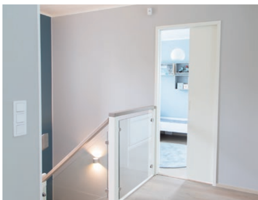
Liune 40 mm ovipaksuudella, vedin upotettu pyöreä kulta.